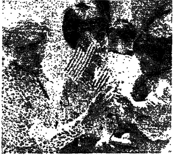
גברת ניכסון וילדי קרית ענבים

גברת ניכסון, מילדי קרית ענבים, התרגשה מאוד במסגרת הלימודים והתעסוקה. היא נהנת מלימודיה ומתעסוקתה, וזאת בזכות המורים והמנצחים המעולים. היא נהנת מלימודיה ומתעסוקתה, וזאת בזכות המורים והמנצחים המעולים. היא נהנת מלימודיה ומתעסוקתה, וזאת בזכות המורים והמנצחים המעולים.